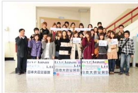
靜宜大學師生心手相連 送愛到日本

「即使身在遙遠他鄉，依然掛念、我能做些什麼？有困難的時候，就該互相激勵、彼此幫助，就是我能做得到的事。你不是孤獨的，艱辛之時，才更要與他人並肩撐過。為了明天，別放棄，張開翅膀、擦乾眼淚，大家共同朝著目標，勇敢迎向未來！」靜宜大學 30 位日本留學生賑災志工團以