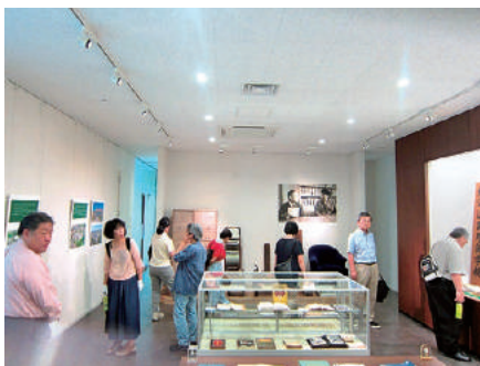
鶴岡記念講堂 鶴岡先生史料室