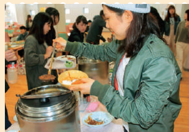
「100円朝カレーバイキング」では3種類の味が楽しめます

朝ごはんの大切さを伝えようとスタートした後援会助成による食育プログラム「100円朝食」は、今年で3年目となります。1食300円のうち、100円を学生が負担し、200円を後援会が助成しています。たくさんの学生に利用してもらおうと、毎月イベント(バイキング等)を実施し、利用を呼びかけています。