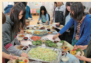
「100円朝食バイキング」は100食が即完売

後期営業は9月28日(木)~11月15日(水)。前期営業とあわせ年100日間の営業を目指します。メニュー表(アレルギー・カロリー)や過去のメニュー写真は、本学HPの「PICK UP」で確認できます。ちなみに前期の一番人気メニューは、最終日のハヤシライス、コールスローサラダ、ワカメスープ、プチロールケーキでした。