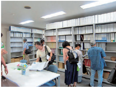
1号館 就職資料閲覧室

最後に本事業にあたり、大学事務局の皆様のお陰で大変スムーズにすすめられたこと、後援会を代表して感謝を申し上げ報告と致します。